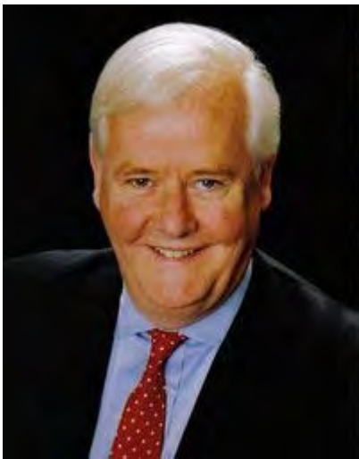
Os Guinness (1941 - )

„Egészen a tizenkilencedik század végéig az egyetemi hallgatók tanulmányainak legfontosabb tárgya volt az erkölcsfilozófia, mai szóval etika, melyet az utolsó évben, az egyetemi tanulmányok megkoronázásaként vettek föl, és a kurzust általában maga a rektor tartotta.”