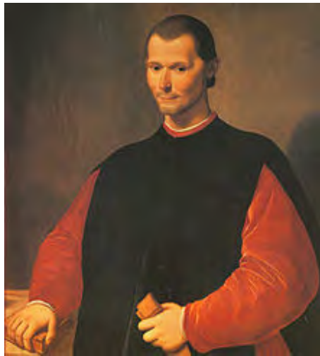
Nicolló Machiavelli (1469-1527)

„Mert aki mindenkire jó akar lenni, gonoszok okozzák a vesztét. Ezért szükséges, hogy a fejedelem hatalmának megóvása érdekében megtanuljon rossz lenni, és ezt a szükségnek megfelelően gyakorolja.”