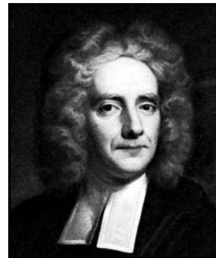
Bernard Mandeville (1670-1733)

„... a vétkek elválaszthatatlanok a nagy és erőteljes társadalmaktól.”