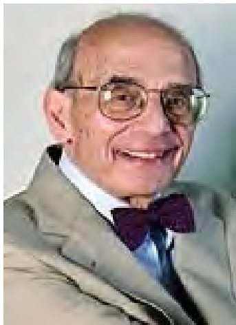
Chris Argyris (1923 - )

„Függetlenül attól, milyen mélyen hiszünk egy probléma helyes megközelítésében a fenyegetés első jelére a legtöbb ember visszatér viselkedésének mélyen gyökerező alapprogramjához”