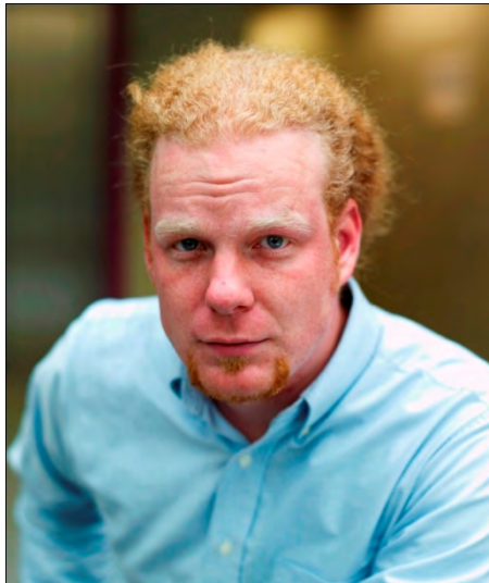
Tomáš Sedláček (1977 - )

„A jó és a rossz közgazdaságtana: Kifizetődő-e a jóság? Ez valószínűleg a létező legnagyobb erkölcsi dilemma.”