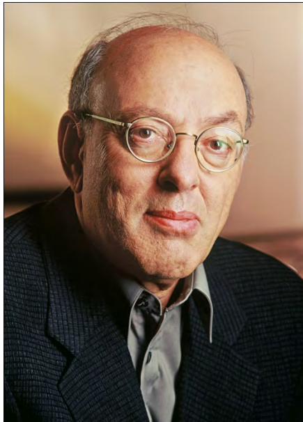
Henry Mintzberg (1939 - )

„A közösség olyan társadalmi ragasztó, amely egy nagyobb haszon érdekében összeköt bennünket”