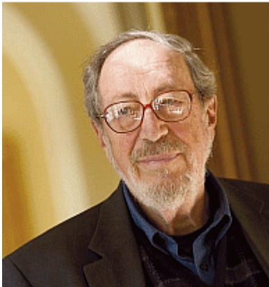
Edgar Schein (1928 - )

„A szervezeti kultúra... „olyan közös alapvető feltételezések mintázata, amelyeket a csoport külső alkalmazkodási és belső integrációs problémáinak megoldása során tanult meg, és amelyek eléggé működőképesnek bizonyultak ahhoz, hogy helyesnek tartsák, ...”