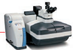
DXR™xi Raman képalkotó mikroszkóp

Nagyteljesítményű, integrált Raman képalkotó rendszer