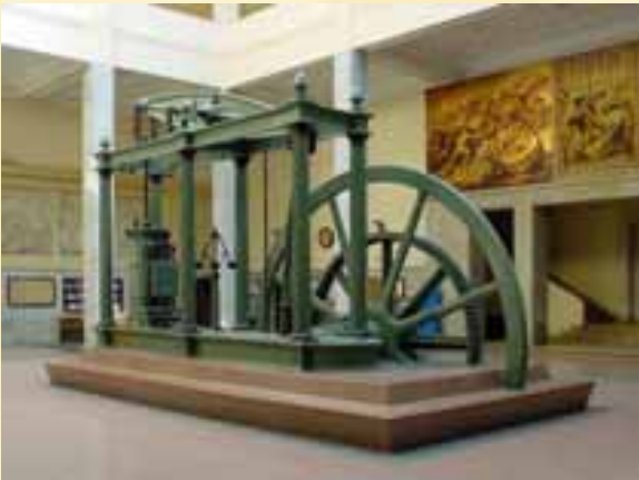
Modern gőzgép (1769)