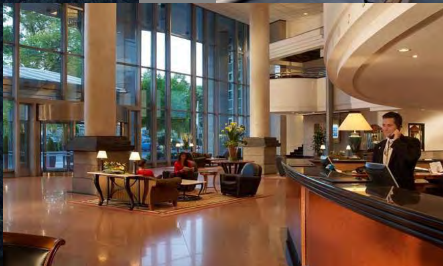
Kempinski Hotel Corvinus Budapest