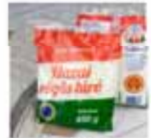
Hasi rigócsa túró