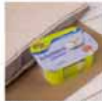
SPAR Free From Níz zsíros laktómentes tehénjoghurt