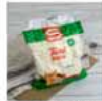
S-Budget Pálizsír 1kg