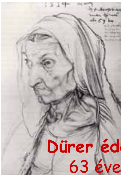
Dürer édesanyja 63 évesen... (1514)