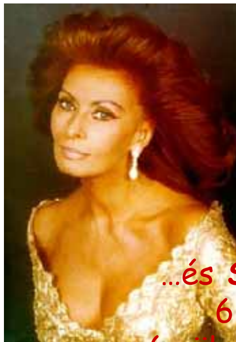
...és Sophia Loren 63 évesen. (szül. 1934. 09. 20.)